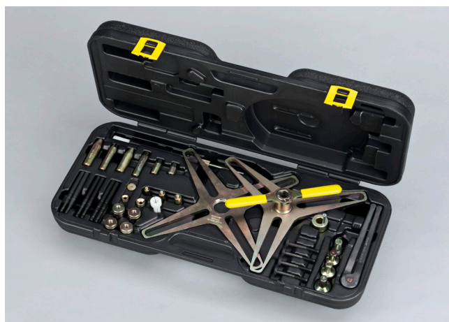
1. ábra: 400 0237 10 számú célszerszám a kuplung szereléséhez

Alapkivitelben a célszerszám 4 - 4 darab M6, M7 és M8 méretű tőcsavart tartalmaz. Ezeket a lendkerékbe csavarják be és az orsó tartójának a felfogására szolgálnak. A fent említett MINI modelleknél olyan lendkereket alkalmaznak, amit M9 méretű menetes furattal láttak el. Ezekhez a járművekhez M9-es méretű tőcsavarok szükségesek.