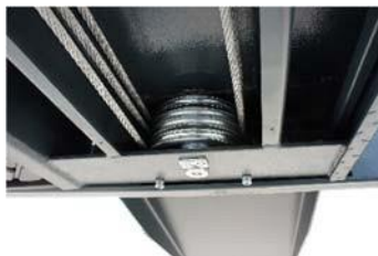
Podwójne koło pasowe