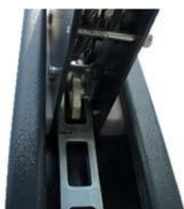
Mechaniczna blokada bezpieczeństwa