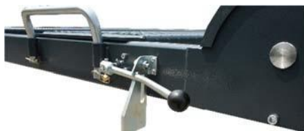
Mechanizm zwalniania blokady