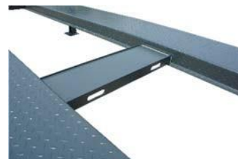
Półka na narzędzia