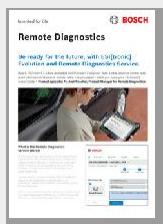
Članak u časopisu