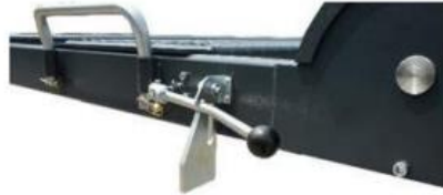
Механизъм за освобождане на заклучването