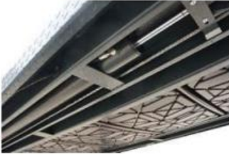
Скоби за задвижване