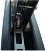
Механична предпазна блокировка