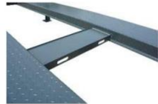
Рафт за инструменти