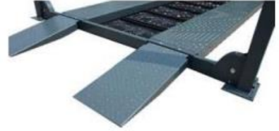
Рампи за преминаване