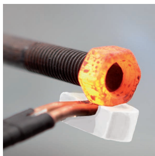
Освобождаване на ръждясали болтове