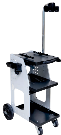
PN. 051331 + 052284 UNIVERSAL 800 + Над висящо рамо