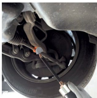
Освобождаване на кормилните връзки