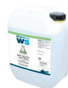
PN. 082212 Охлаждаща течност за заваряване - 2 л