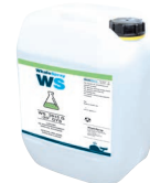
PN. 062511 Охлаждаща течност за заваряване - 5 л