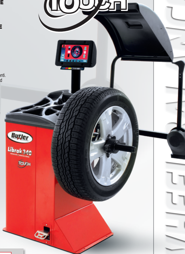
LIBRAK 340TOUCH + GAR301

Maquina profesional con las funciones más recomendadas por los operadores más exigentes. Rapidez de uso gracias al arranque automático al bajar la protección de rueda y bloqueo automático de la misma en la posición de desequilibrio exterior. Facilidad de trabajo gracias a los mandos interactivos que guían el operador durante todas las fases del equilibrado.