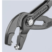
Praktični rotirajući umetci za zahvaćanje omogućuju dobar pristup objjmici iz svakog položaja