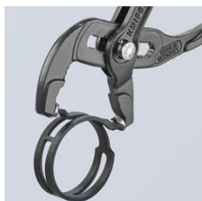
Objumica koja štedi prostor

Zadržano pravo na tehničke izmjene i zabune