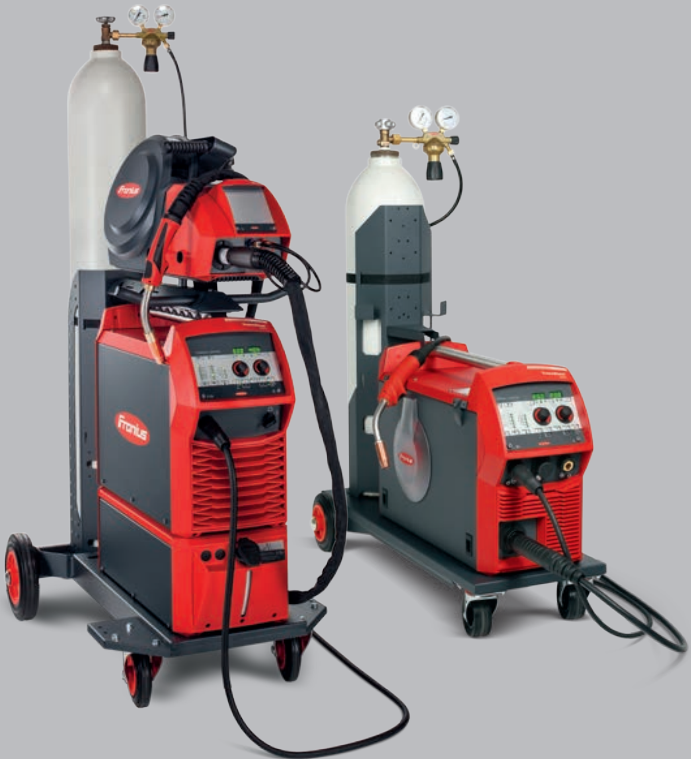
TRANSSTEEL 3500 SYN / TRANSSTEEL 5000 SYN