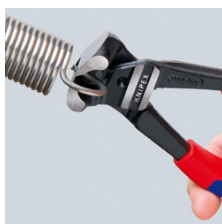
velika performansa sječenja: i za piano žicu