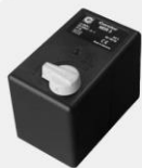
Przeosłata CONDOR z zabezpieczeniem