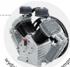
wydajne, cztero-tłokowe pompy