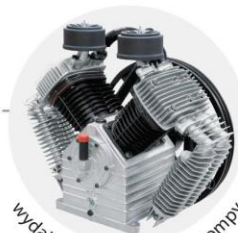
wydajne, cztero-tłokowe pompy