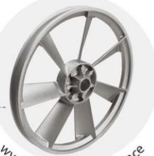
wydajne łopatki chłodzące