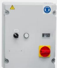
rozruch gwiazda-trójkąt (w modelach „SD”)