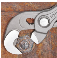
Rad na zahrđalim maticama s otupjelim rubovima