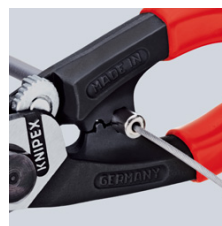
pritiskanje završne čahure na Bowden omotač