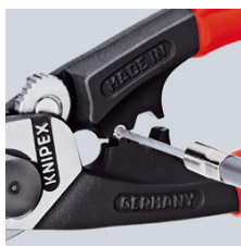
pritiskanje završne kapice na vlačno uže