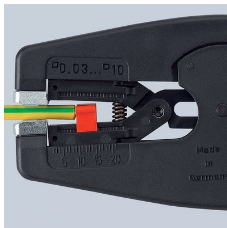
Štípačky na drát do 10 mm 2 vícežilový