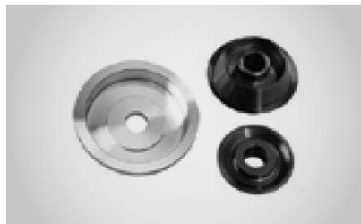
PN: 1695 654 849 Zestaw stożków 88-174mm Cena: 1557zł netto