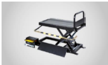
PN: 1695 900 004 Winda koła Cena 5873zł netto