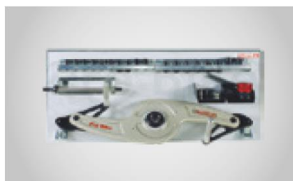
PN: 1695 654 039 Uchwyt motocyklowy 19mm Cena 4307zł netto