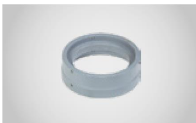
PN: 1695 606 200 Dystans do bliźniaków Cena: 609zł netto