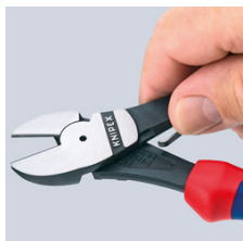
74 12: opruga za otvaranje jednostavno se aktivira pritiskom palca

Zadržano pravo na tehničke izmjene i zabune