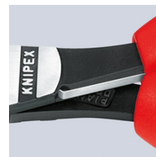
74 12: opruga za otvaranje u deaktiviranom položaju