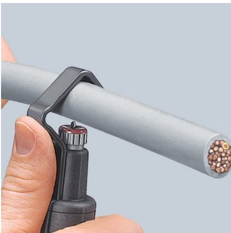
Przystawianie narzędzia do cięcia po obwodzie

Dopuszcza się zmiany i błędy w podanych parametrach technicznych