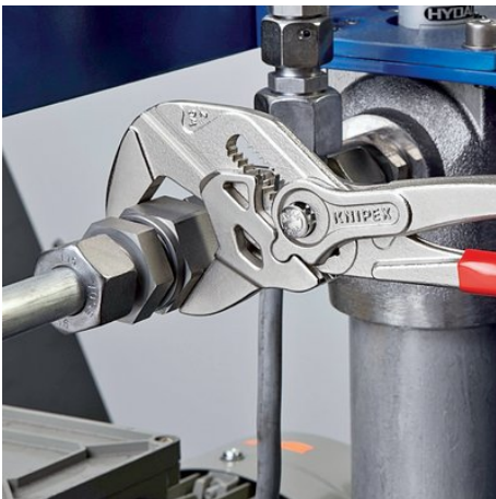
Zastępuje wieloczęściowy zestaw kluczy metrycznych i calowych