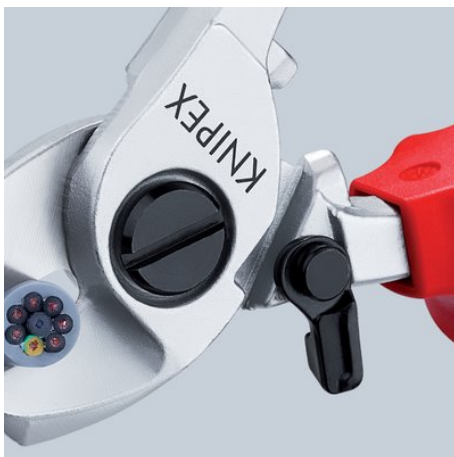
95 26 165: blokovací západka zablokuje nůžky pomocí vnitřní pružiny pro rozevření