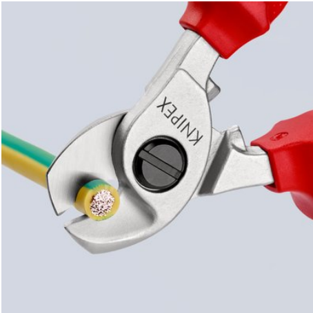
Přestřížení kabelu kleštěmi na kabely: lehký, čistý řez bez deformace kabelu