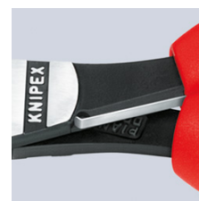
74 12: opruga za otvaranje u deaktiviranom položaju