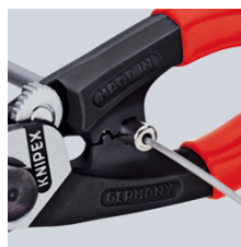
pritiskanje završne čahure na Bowden omotač