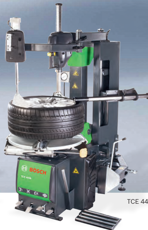
TCE 4430 S44

Nowe montażownice opon Bosch TCE 4430 oraz TCE 4435 oferują warsztatom szereg innowacyjnych rozwiązań. Zostały stworzone pod kątem zapewnienia maksymalnej szybkości, wydajności oraz trwałości. Stanowią optymalny wybór również do obsługi opon typu UHP i RTF do samochodów osobowych oraz opon do lekkich pojazdów ciężarowych. Przy zastosowaniu odpowiedniego wyposażenia dodatkowego nadają się również do opon motocyklowych.