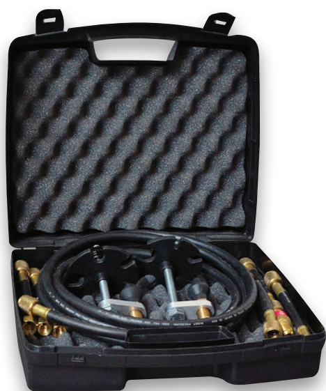
Opcjonalny zestaw do płukania*