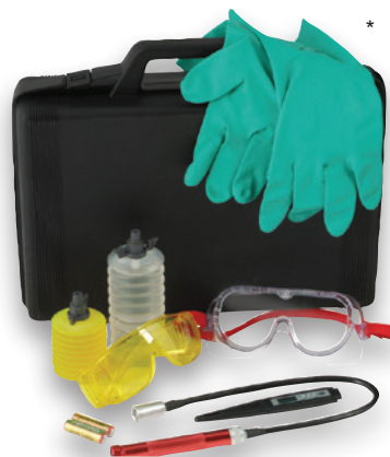
Opcjonalny zestaw akcesoriów*