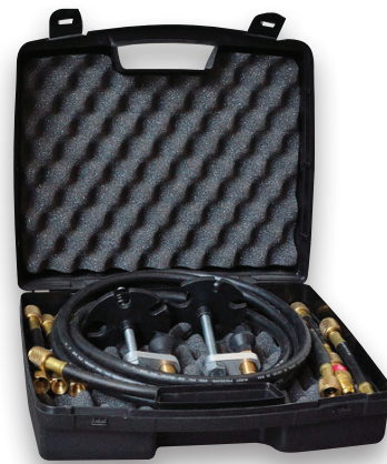
Opcjonalny zestaw do płukania*