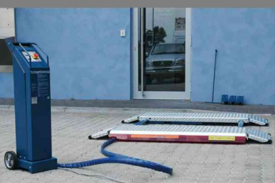
SPRINTER MOBIL 2500